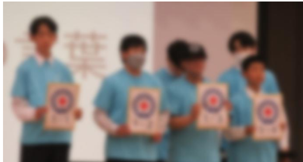
JRCのバッジを受け取った1年生の各クラス代表