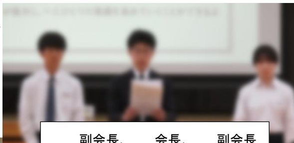
副会長、 会長、 副会長

生徒会は生徒の 自治組織 です。 1/379 の1 ではなく、 1/1 の1 として、 一人一人が参加してほしいと 願っています。