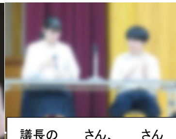
議長の さん、 さん