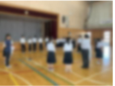
生徒総会后、みんなで頑張った内容について振り返っています。